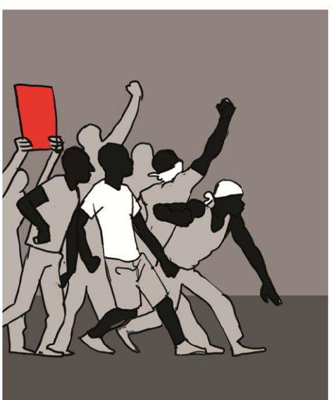
פערי מצמדות יוצרים צעם אצל אלו שלא קיבלו הצדמנות שווה. שלושה במחיר אחד במקום ואהבת לרעך כמוך.