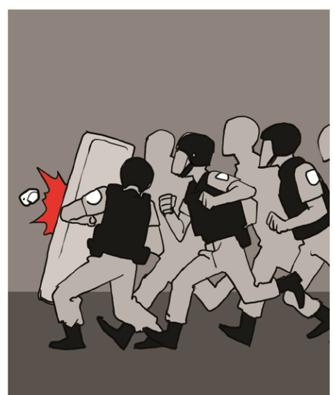
בישראל, המקרים שבהם שוטרים מפעילים כוח מופרז ללא הצדקה על אתיופים מתרבים כמו סניפים של מקדונלד'ס.