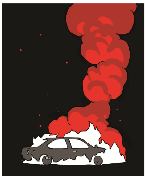
באמריקה, כשאדם לבן יורה באדם שחור ללא סיבה, זאת הצננות. 200 שנה של הצננות שמתנקזות לאצבע על ההדק.