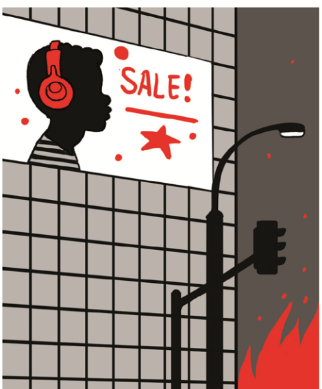
האתיופים חלמו על ארץ ישראל והוצלו בשם הציונות. הם נקלטו כאזרחים שווי זכויות.