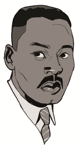
דין הופיצ עם השיר בצעדת וושינגטון לצבודה וחירות ב-1963, שבשיאה נאם מרטין לותר קינג את נאומו המפורסם "יש לי חלום".