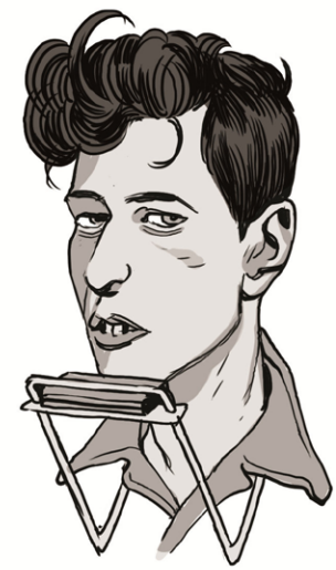
בוב דין כתב על זה שיר. בשנות השישים הצען לבן ירה למוות במדהר אברס, פציל זכויות אדם שחור.