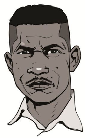
בשירו "פיון במשחק שלהם" טוען דין שהצניים הלבנים הם כלי משחק בידי אליטה עשירה של פוליטיקאים שמרוויחה מהשנאה בין המצמדות הנמוכים.