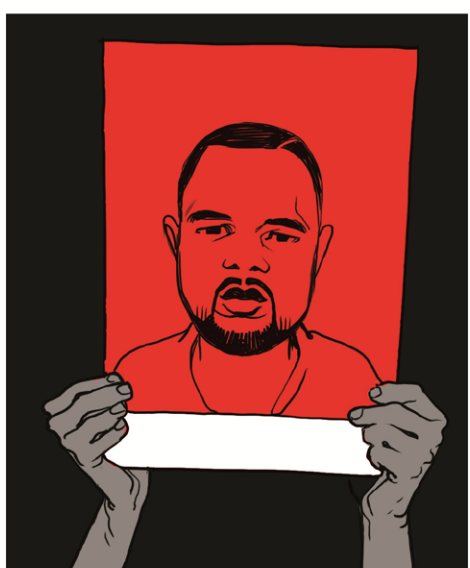
אולי עכשיו האתיופים ייהפכו סוף-סוף לישראלים באמת. כמו שהמצרחים יצאו מהמצברות רק אחרי שהפכו את המדינה. יום אחד מישהו יכתוב על זה שיר.