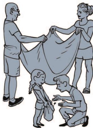
השמש שקעה וזה הזמן שלנו ללכת. אנחנו אוספים קליפות תפוחים ומקפלים את המחצלת. עוד מצט נהיה בחזרה בצולם הרגיל. מרחוק כבר שומעים את הכביש.