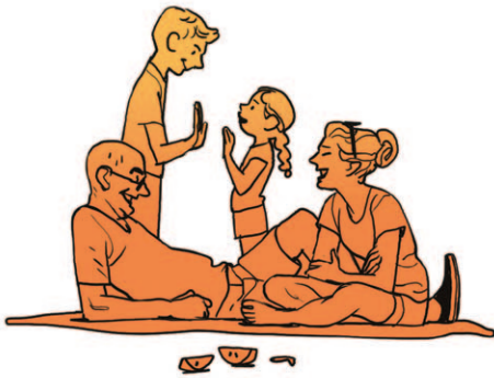
הילדים משחקים יחד, אנחנו מאוהבים. מסביבנו כל מיני אנשים שהגיעו לכאן בטעות, ואפילו כמה כלבים. כולם מחייכים בשקט. הם יודעים את הסוד.