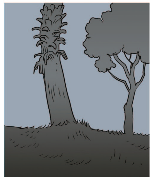
הלוואי שכל המקומות שהיינו בהם היו כמו המקום הזה. אבל רוב המקומות מכוצרים - כבישים, חניונים, מסדרונות צרים וחדרים מנוכרים. מקומות שרבים בהם וכוצסים.