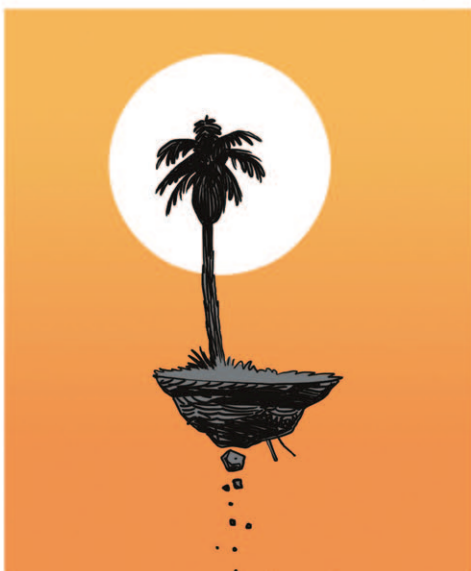
אז אם יוצא לכם לראות פיסת דשא, קצת מצל הצננים, תדעו שזה המקום שלנו. אתם מוזמנים כמובן, אתם תהיו מאושרים שם, לפחות עד שהשמש תיצלם.