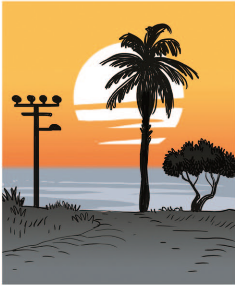
יש שם זווית מיוחדת שיוצרת הרהשה של ריחוף. כמו להיות על ענן.