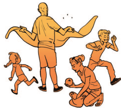
אנחנו מהיטים אחר הצהריים, פורסים מחצלת, מקלפים תפוחים ומתכוננים.