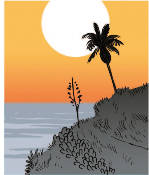
יש מקום בתל אביב שהוא רק שלנו. שפוע דשא קטן מול הים.